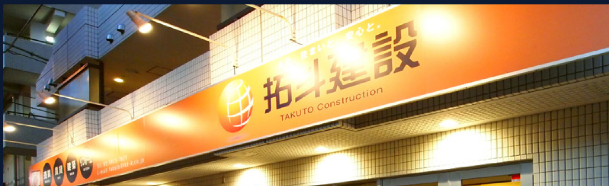
環七通りの側道面、オレンジ色の看板&はためくのぼり旗が目印です。