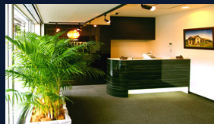
当社エントランス。気軽にお立ち寄り下さい