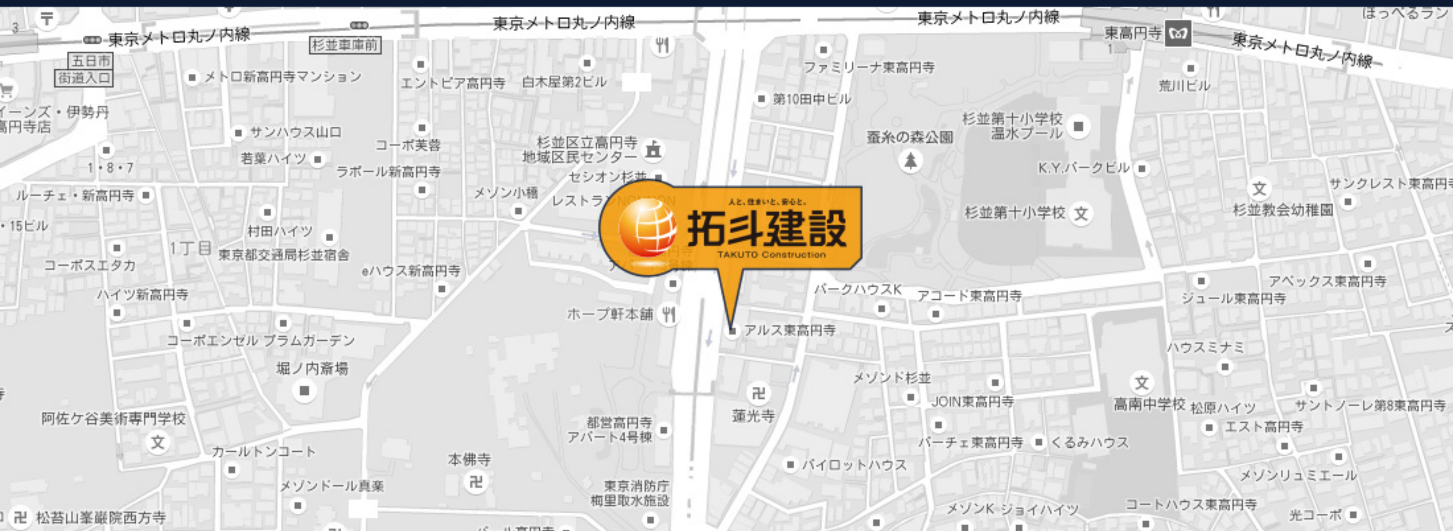
東京メトロ 丸ノ内線 東高円寺駅1番出口より徒歩5分